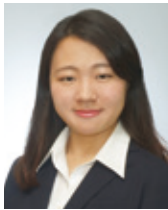
(株)野村総合研究所 副主任コンサルタント

砂山・生物の群れ・感染症・電力…これらに共通するものは何でしょう。 世の中の現象を理系の目で捉えるとそれが見えてきます。 数理モデリングを用いた社会問題解決への取り組みについて紹介します。