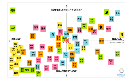
【ジャムボード使用時】