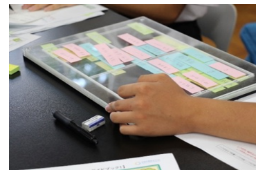
【対面でのアクリル板使用時】